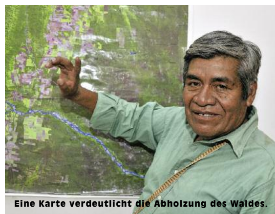
Eine Karte verdeutlicht die Abholzung des Waldes.

Beim Verlassen des Dorfes lässt Verwesungsgeruch den Atem stocken. Er stammt von einem Rinderkadaver neben einem Tümpel, der eine bräunliche Brühe enthält. Die Einwohner von Cuchuy trinken daraus.