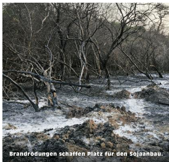
Brandrodungen schaffen Platz für den Sojaanbau.

Rodung in der Region. Eine Kopie wird der Oberste Gerichtshof erhalten, der damals auf die Verfügung drang – seinerzeit ein großer Erfolg der Arbeit von ASOCIANA.